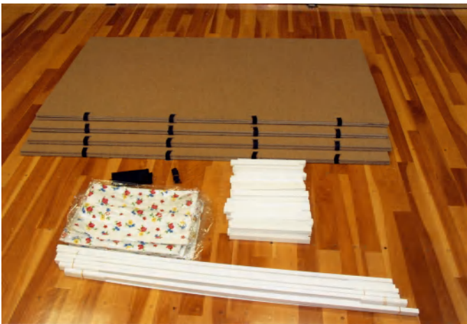
シンプルな部品構成