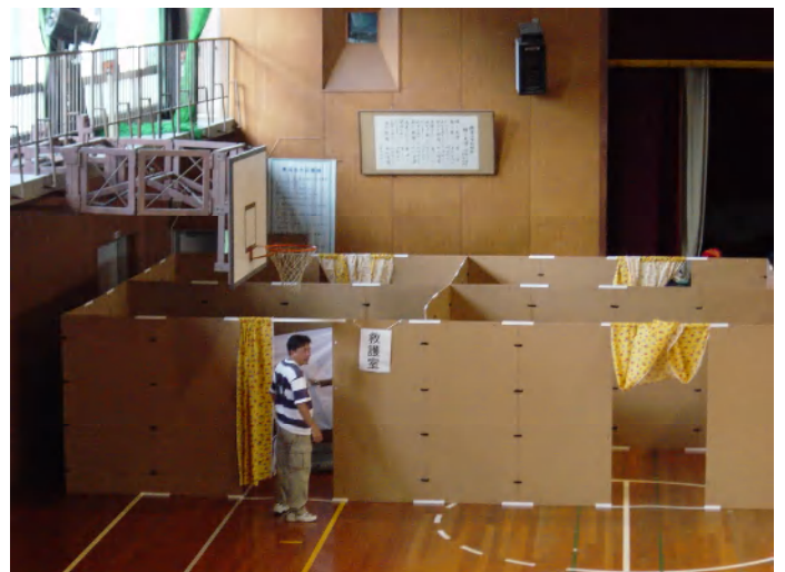
発災直後は救護室、着替室、授乳室として 福祉避難所のベッド間の仕切りにも最適