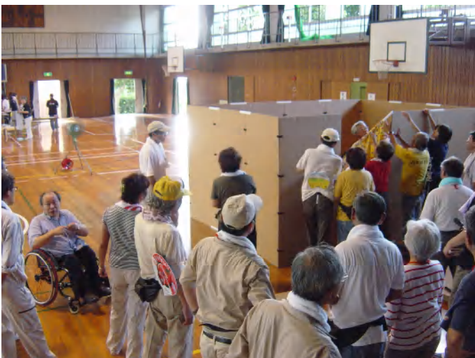
地域の防災訓練での組み立ての練習と 避難所生活疑似体験